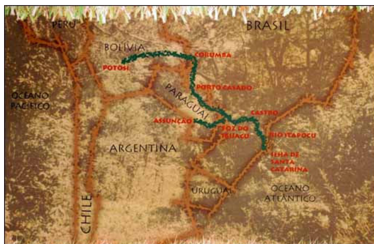
Figura 2: Mapa do Caminho de Peabiru.