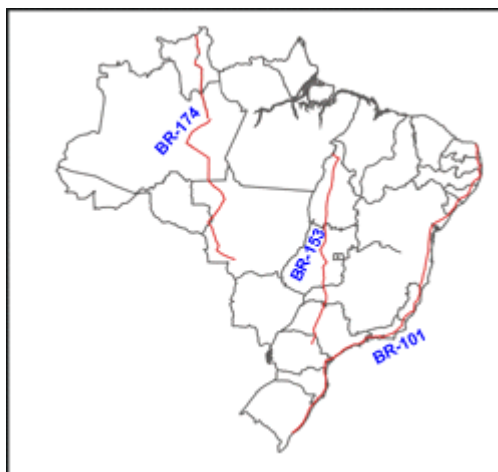
Figura 7: Rodovias Longitudinais