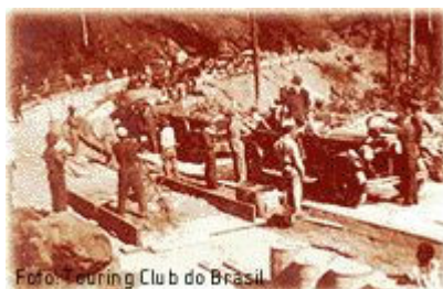
Figura 5: Estrada União e Indústria