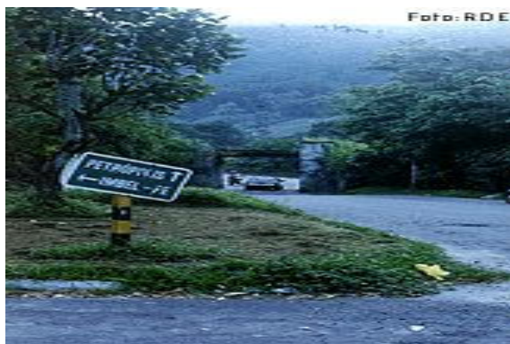
Figura 4: Estrada da Estrela

Em 1841, o major Júlio Frederico Koeler foi encarregado pelo Imperador D. Pedro II de construir um melhor caminho de Porto da Estrela ligando Rio de Janeiro-RJ a Petrópolis-RJ onde a família imperial costumava passar temporadas. Surgiu assim a estrada Normal da Serra da Estrela que pode ser percorrida até hoje.