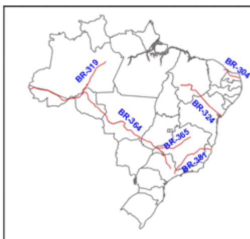
Figura 9: Rodovias Diagonais