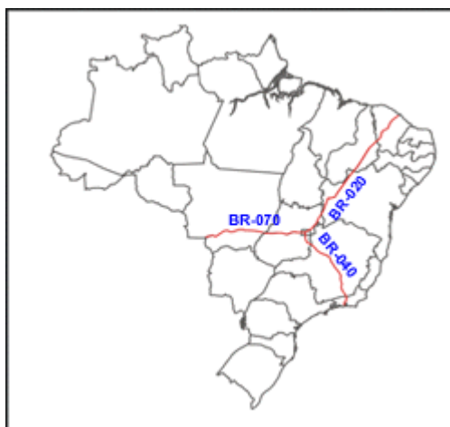
Figura 6: Rodovias Radiais

São as rodovias que partem da Capital Federal em direção ao extremo do país, são apenas oito estradas radiais: BR-010, 020, 030, 040, 050, 060, 070 e 080. O primeiro algarismo inicia-se em 0 (zero) e a numeração pode iniciar em 05 até 95 no sentido horário. Ex: BR-040.