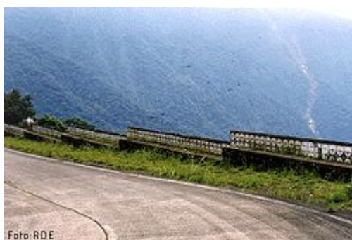
Figura 3: Caminho do Mar

A Estrada Caminho do Mar localizada no estado de São Paulo (SP-148) ligando Santos ao planalto paulista via ABC, é a estrada mais antiga construída que se tem registros. Teve início em 1560, quando Mem de Sá (na época Governador geral do Brasil 1558-1572) encarregou os jesuítas de abrir novo caminho ligando São Vicente ao Planalto Piratininga. Com o tempo a via foi se deteriorando dificultando a passagem e em 1661 o Governo da Capitania de São Vicente mandou construir a Estrada do Mar com mais de 70 pontes, permitindo então o tráfego de veículos. A estrada foi abandonada de 1844 até 1905 devido à concorrência sofrida na época pela via férrea, em 1913 ela foi reconstruída, em 1922 foi pavimentada em concreto, atualmente está em fase de recuperação e aberta somente para fins turísticos.